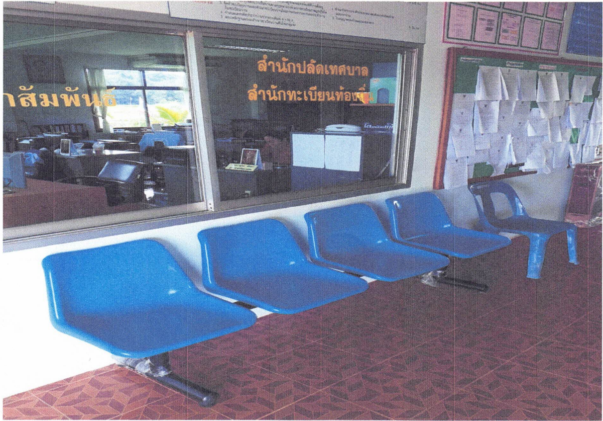
การจัดที่นั่งสำหรับประชาชนและพนักงาน