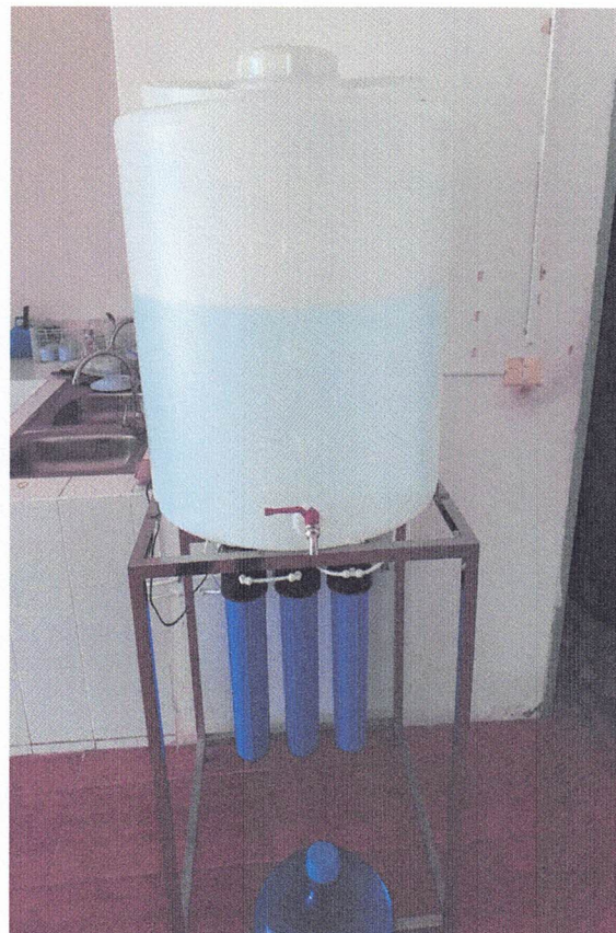
เครื่องกรองน้ำ