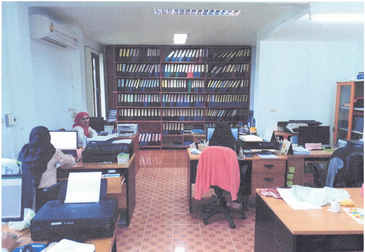
การจัดพื้นที่ทำงาน