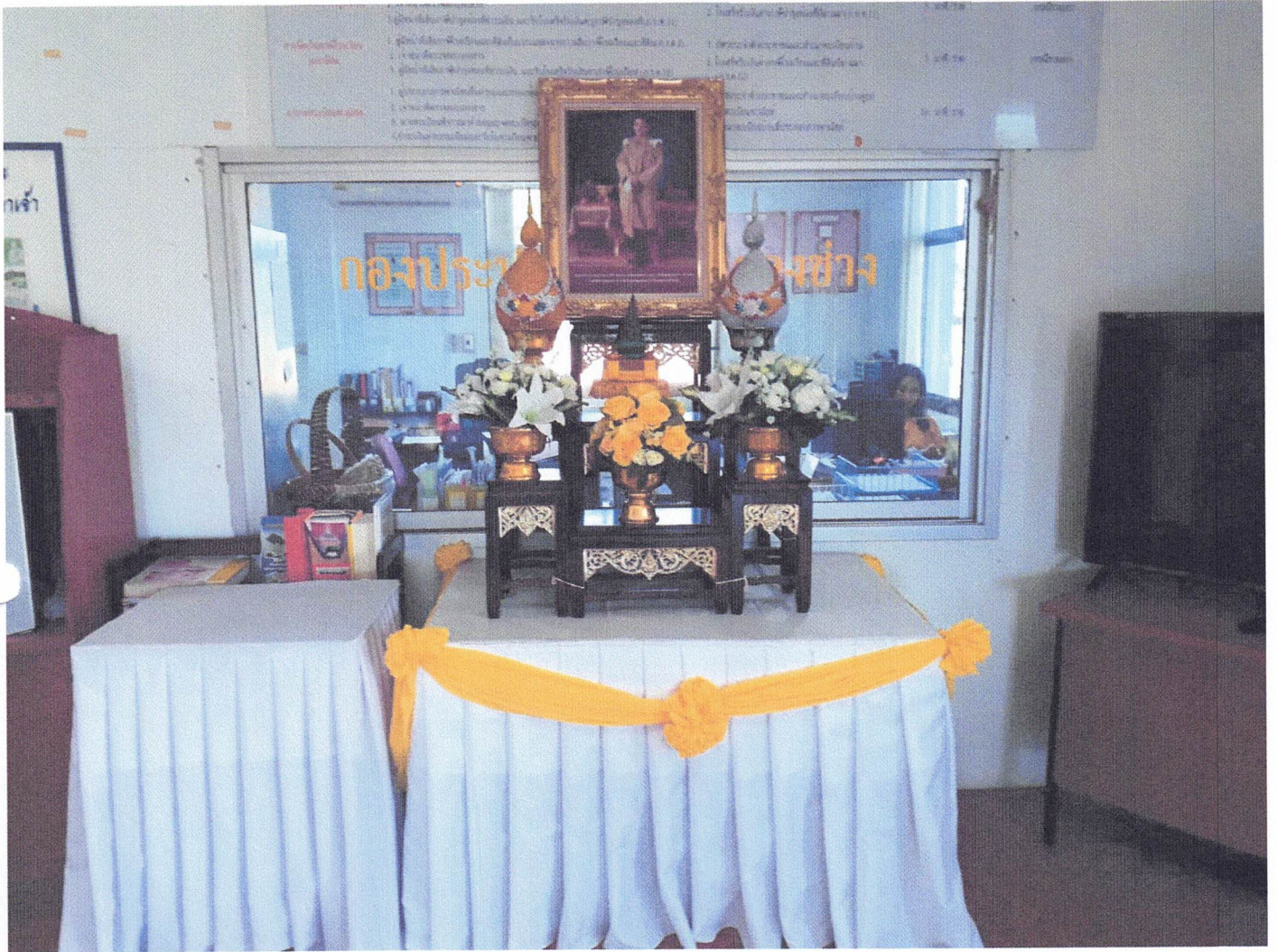
โต๊ะหมู่บูชา